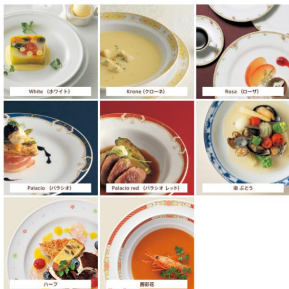
病院・福祉施設 洋食器：絵柄で探す