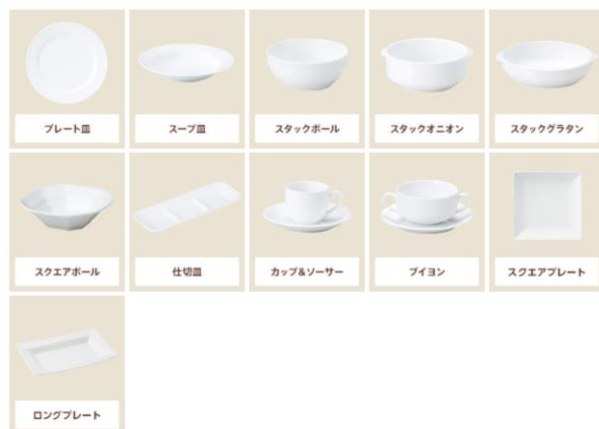
病院・福祉施設 洋食器：形状で探す