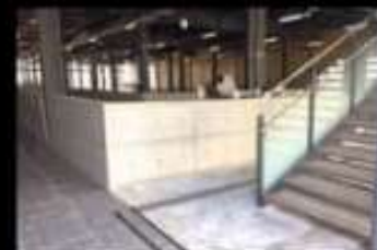
②文化芸能劇場 (5号) エレベーターからの 搬出入